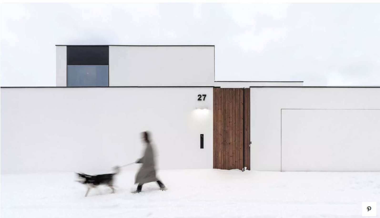
House 4 level WEST FACADE