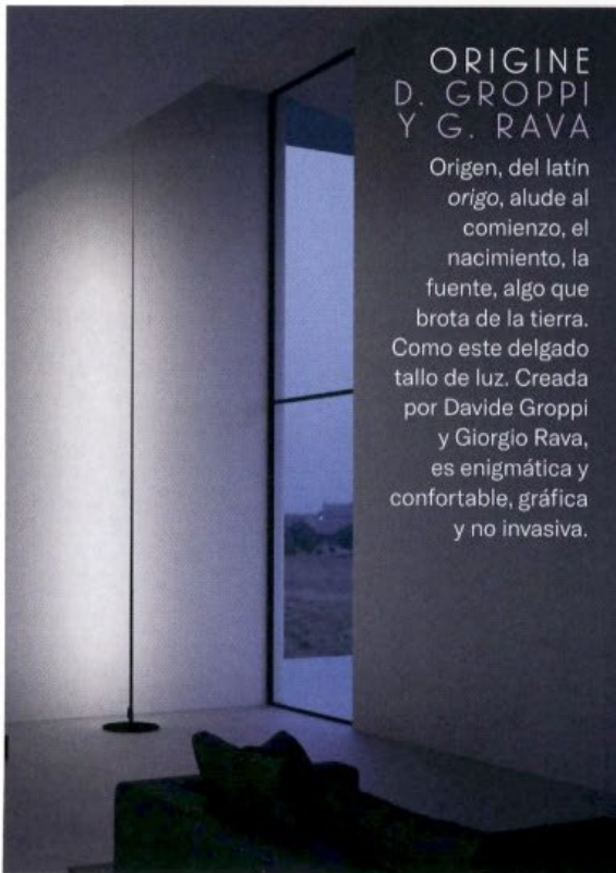
ORIGINE D. GROPPI Y G. RAVA

Una forma básica que realza la belleza del vidrio soplado según la antigua técnica veneciana. El equipo BIG (Bjarke Ingels Group) firma esta pieza, de Artemide, cuyo degradado de color es siempre único ya que se realiza artesanalmente.