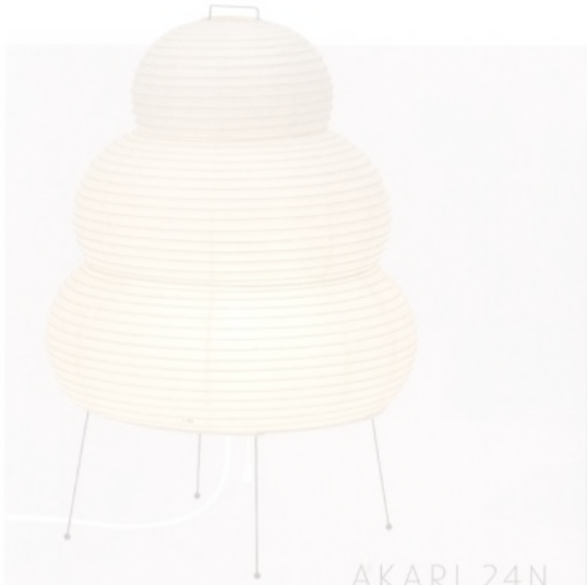
AKARI 24N ISAMU NOGUCHI

Gifu, en Japón, es reconocida por sus linternas y parasoles de papel de corteza de morera y bambú. Allí, Isamu Noguchi concibió en 1951 la colección escultural Akari. De Vitra.